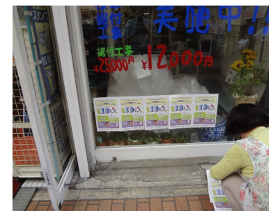
街のお店ショーウィンドーに貼られた10周年の宣伝チラシ

くらしの相談センター開設10周年のつどい 企画が決まり成功に向けスタート くらしの相談センター開設10周年のつどい 6月14日、27名の実行委員会で第1回の会議を開き9月29日の集いは300名以上の参加を目標に取り組みました。6月28日に事務局を選出し7月3日に第3回実行委員会を開催しチケット380枚をそれぞれに配分し、7月10日まで全員に届けました。チラシは7月8日から川崎市内44の公共施設に1450枚置かせて