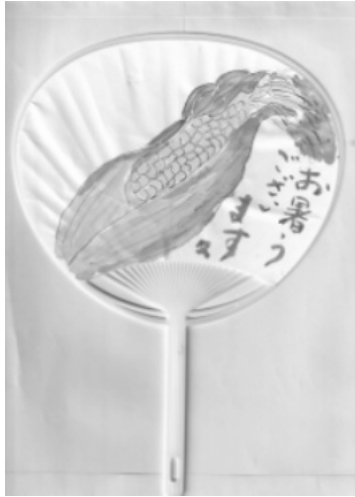
うちわに トウモロコシの絵