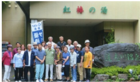
道志川清流の傍に在る「紅椿の湯」

雨の中、山中湖、花の都公園、河口湖を巡り帰路につきました。緑と清流、温泉と人の温もりを感じた、夏の終わりにふさわしい心に残る旅でした。