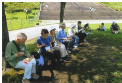
宮ヶ瀬ダム(川崎の水源地)の公園木陰でお弁当昼食

初日は好天に恵まれ、一路宮ヶ瀬の県立あいかわ公園へ。紺碧の空の下、広大な緑の芝生に座り込み、