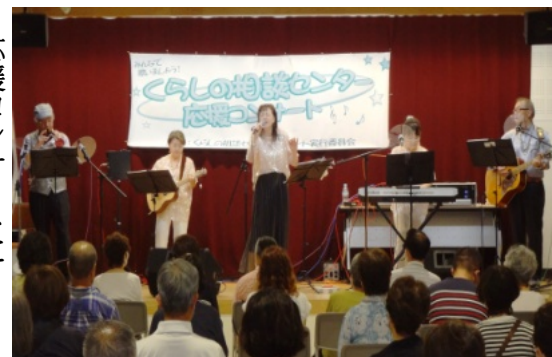
応援コンサートに参加して