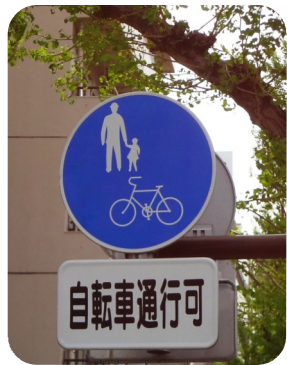
普通自転車歩道の標識