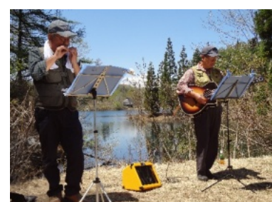
希望湖のほとりでののんべらずの演奏を聴きながら昼食最高の贅沢でした