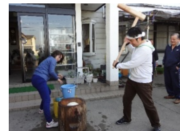
翌朝6時、宿での餅つきもやりました