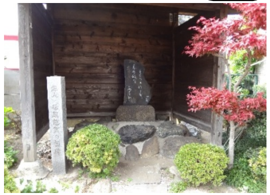
八丁駅近くにある松尾芭蕉の句碑 芭蕉没後300年の年、平成6年12月に建てられました。“麦の穂を たよりにつかむ 別れかな” (かわさき大師観光ガイドの会より)