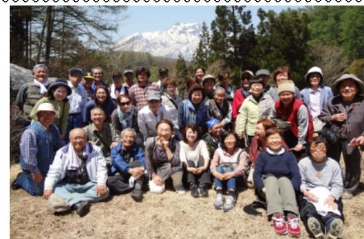
雪の妙高山をバックに希望湖のほとりで。